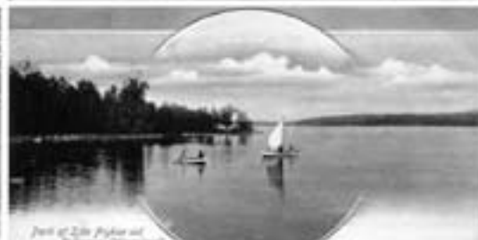
Part af Öde Fyrbrik af Eders (Wernsted)