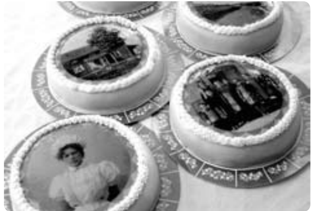
Vi firar med att tillgängliggöra våra tårter.