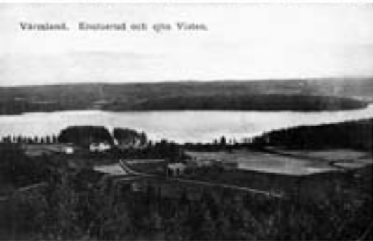
Värmland, Enskared och ägna Viten