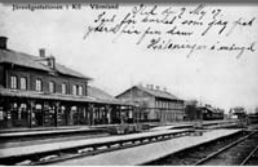
Hövedsgården i Kils Värmland

Stad den 24 Aug 17 Sagt för berätt som jag fick gärde från den hvar Kilsmånst i smångh