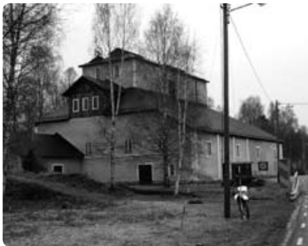
Motjärns- hyttan.

År 1883 var det åter dags för en modernisering av hyttan- läggningen efter ritningar av Gustav Uhr. En ytterligare mo- dernisering företogs år 1901, men denna ingrep ej nämnvärt i Uhrs uppläggning. Några av de förändringar som skedde vid dessa två moderniseringar var bland annat en av Uhr konstru- erad turbin, som drev krossanläggning och spel. År 1901 flyt-