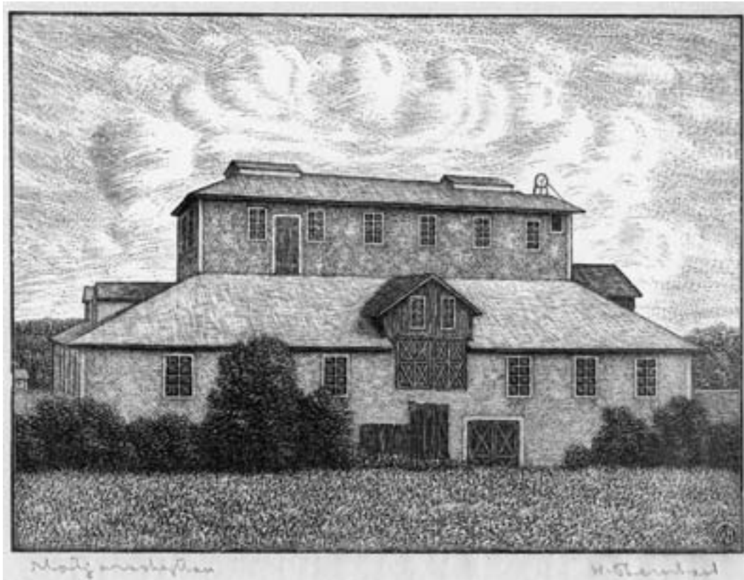
Motjärnshyttan. Träsnitt av Waldemar Bernhardt.