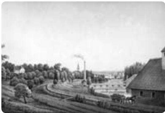
Vy över Övre Bruket och Borgviksälven nära dess utlopp i Borgvikssjön. Rallvägen användes för transporter av kol, malm och järn, men också för transporter av trävaror från sågverken kring Värmeån. I bakgrunden ses den vita herrgården, som brann ner till grunden år 1933, och kyrkan. Litografi av A. Naylith