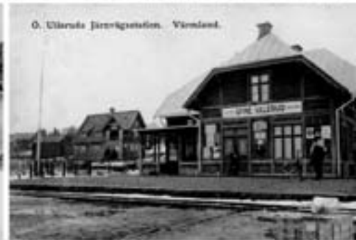
O. Ullareds Järnvägsstation, Värmland.