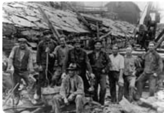
På 1930-talet grävdes Borgviksälven ut med syfte att utvinna mer elström ur Borgviksforsen i och med att den nya kraftstationen byggdes. I samband med grävningarna påträffades ett flertal stenålderssyxor som visar att trakten varit bebyggd sedan länge.

bitar av vapen m. m. Slottet skulle ha legat på den upphöjda slätten väster om åkermarken i Värmerud.