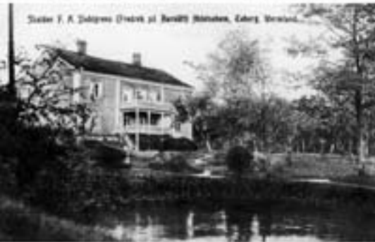
Slottet i A. Dalgrens Ordet af Beritt Wäner, Eders, Wernsted.