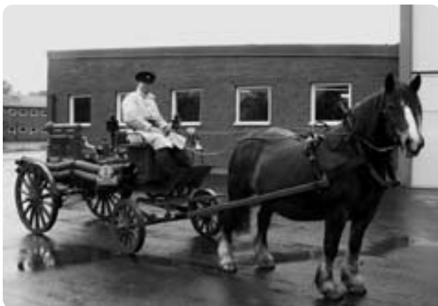
Bilder från Veteranbransbilsrallyt i Sunne 4 juni 2005. Ludvigsberg hästdragen handpump. Släckbil Volvo Lv 84 årsmod. 1937 och motorspruta API 80 från 1935.