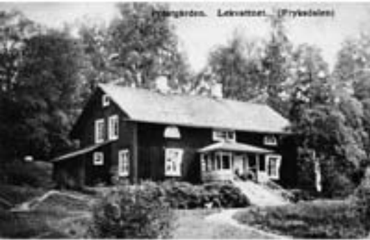
Örnsgården, Lekvattnet, (Fryksdalens)