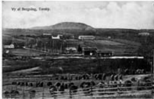
Vy af Norrby, Teby.