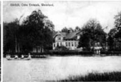
Såväl, Öde Enten, Svane.