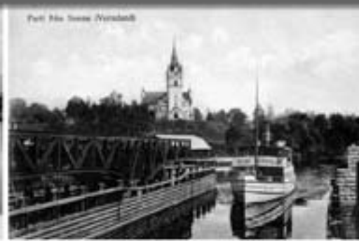
Part till Svane Värmland