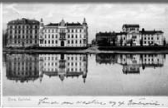
Örn, Gullst. För en som vaxlar, sig g. Jantvick.

Stad den 24 Aug 17 Sagt för berätt som jag fick gärde från den hvar Kilsmånst i smångh