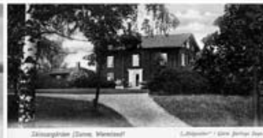
Slottet i A. Dalgrens Ordet af Beritt Wäner, Eders, Wernsted