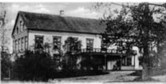
Slottet i A. Dalgrens Ordet af Beritt Wäner, Eders, Wernsted.